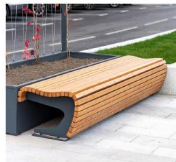
Скамья парковая Аданат «Счастье»