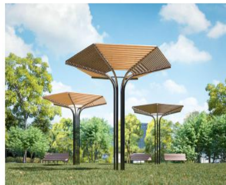
Навес Aira «Bloom»