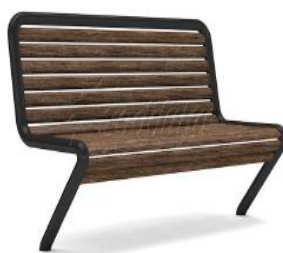
Скамья парковая Хоббика «Яуза»