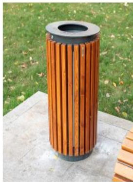
Урна парковая Хоббика «Краков»