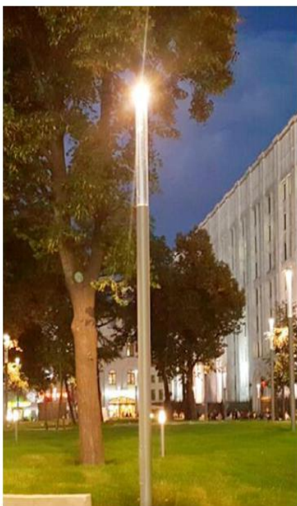
Осветительная система Сарос «Маяк»