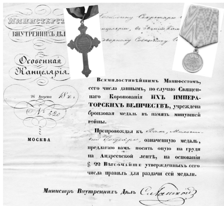
Свидетельство о праве ношения медали на Андреевской ленте и медаль. Наперсный крест из бронзы коричневого цвета на Владимирской ленте.