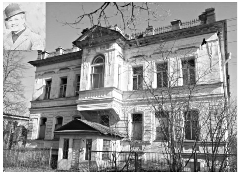
Дом жилой (особняк) В.И. Каялина построен в начале XX века

Более подробно познакомимся с ним в следующей